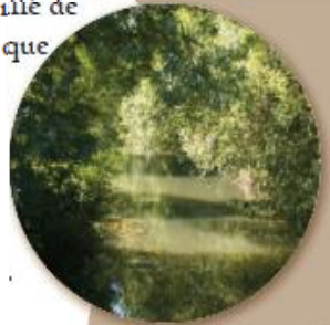
▲ Zones d'ombre et de lumière profitables à la faune aquatique.