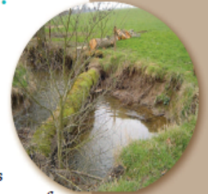
▲ Encombre obstruant totalement le lit, à enlever.