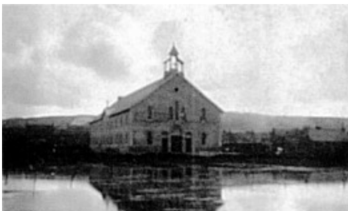
L'église Saint-Joseph des Mielles ou chapelle provisoire peu après sa construction vers 1915, se reflétant dans le marais environnant.

Le portrait de l'architecte sera complet avec l'évocation de son action politique et sociale. Il défend dans sa jeunesse les idées du pape Léon XIII (1810-1903), surnommé le « pape des ouvriers » qui prônait le ralliement des catholiques français à la République. René Levesque resta fidèle à cet idéal et fonda à Cherbourg une section du parti démocrate populaire. Il est également l'un des fondateurs de la première foire-exposition de Cherbourg vers 1925.