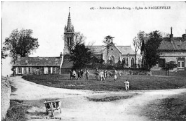
René Levesque a rénové l'église de Nacqueville. Cet édifice a été détruit lors des combats de la libération du Cotentin en juin 1944.