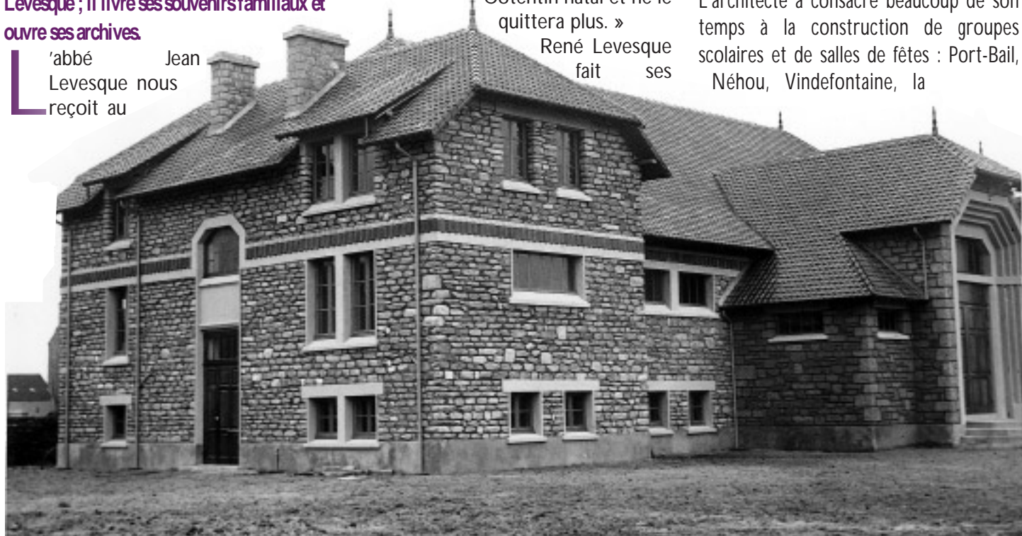
La salle de théâtre Buisson a été réalisée peu avant la seconde guerre mondiale selon les plans et sous la direction de l'architecte René Levesque.

L'architecte a consacré beaucoup de son temps à la construction de groupes scolaires et de salles de fêtes : Port-Bail, Néhou, Vindefontaine, la